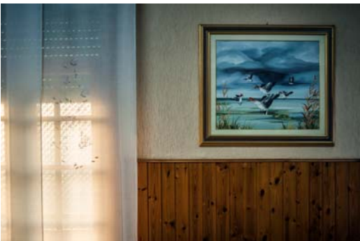
Simone Letari "Polesine terra fluida"