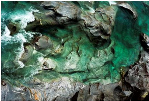
Luigi Lusini BFI "Le forme dell'acqua" (cartoline)