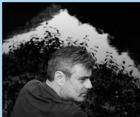
MARCO BARSANTI www.marcobarsanti.it

Ho iniziato a dedicarmi alla fotografia nei primi anni ottanta come autodidatta, poi alcune esperienze specifiche in terra americana mi hanno stimolato ad approfondire le mie conoscenze. Nel 1994 un incontro-studio con i fotografi John Sexton e Morley Bear mi ha consentito di esplorare in maniera più estesa i contenuti del linguaggio fotografico.