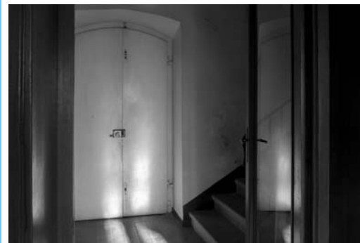
Simona Lunatici "Penombra"