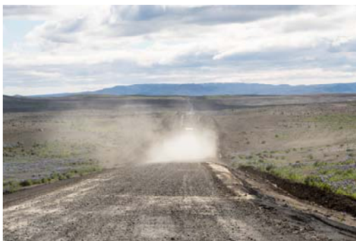
Luca Salotti "Attori non protagonisti" [Islanda]